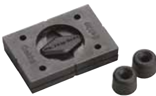
SWIVEL HANGER Support pivotant

Support pivotant pour bricoleurs - simple, efficace et élégante. Peut être installée à l'extérieur comme à l'intérieur sur des surfaces verticales ou inclinées pour suspendre des cadres, des miroirs, des oeuvres d'art, des décorations murales, des tableaux noirs, des boîtes aux lettres des haut-parleurs et bien plus encore!