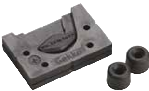
WEDGE HANGER Fixation à emboîter

Fixation à emboîter pour bricoleurs - simple, efficace et élégante. Peut être installée à l'extérieur comme à l'intérieur sur des surfaces verticales ou inclinées pour suspendre des cadres, des miroirs, des oeuvres d'art, des décorations murales, des tableaux noirs, des boîtes aux lettres des haut-parleurs et bien plus encore!