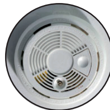
DÉTECTEURS DE FUMÉE

4 La vis déclenche le son "POP" indiquant l'ouverture de l'ancrage, verrouillant le SNAPSKRU au mur