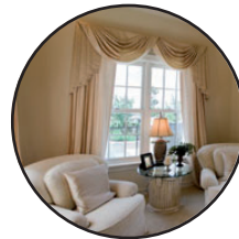
PÔLES À RIDEAU